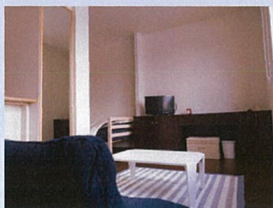
光回線完備 Wi-Fiも使えます