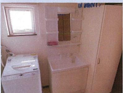
シャワードレッサー 乾燥機付き洗濯機