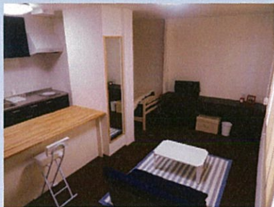
リビング モニターホン付でセキュリティ万全

周辺情報 スーパーマーケット (Aコープゆうべつ店) が目の前にあります。 最寄のコンビニまで車で1分。(セブンイレブン、セイコーマートがあります)