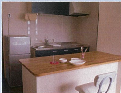
カウンターキッチン 食器・家電一式揃ってます